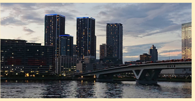
閉会式に向かうバスが大行列な橋、見えますか？